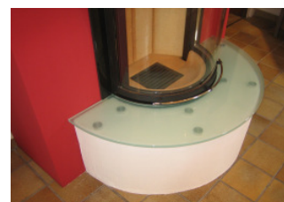
Spartherm MDR mit 250 mm Vorlegeplatte