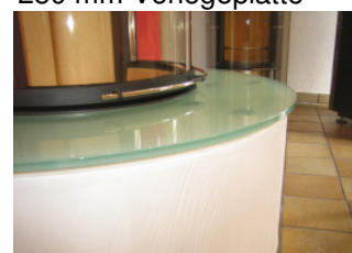
Spartherm MDR mit 250 mm Vorlegeplatte