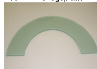
Vorlegeplatte 200 mm